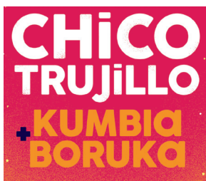
Chico Trujillo (03/07)