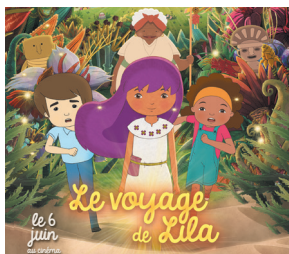
Le voyage de Lila