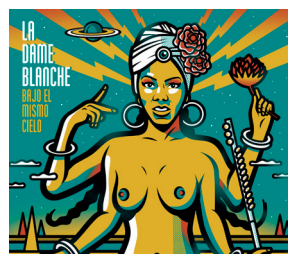
La Dame Blanche